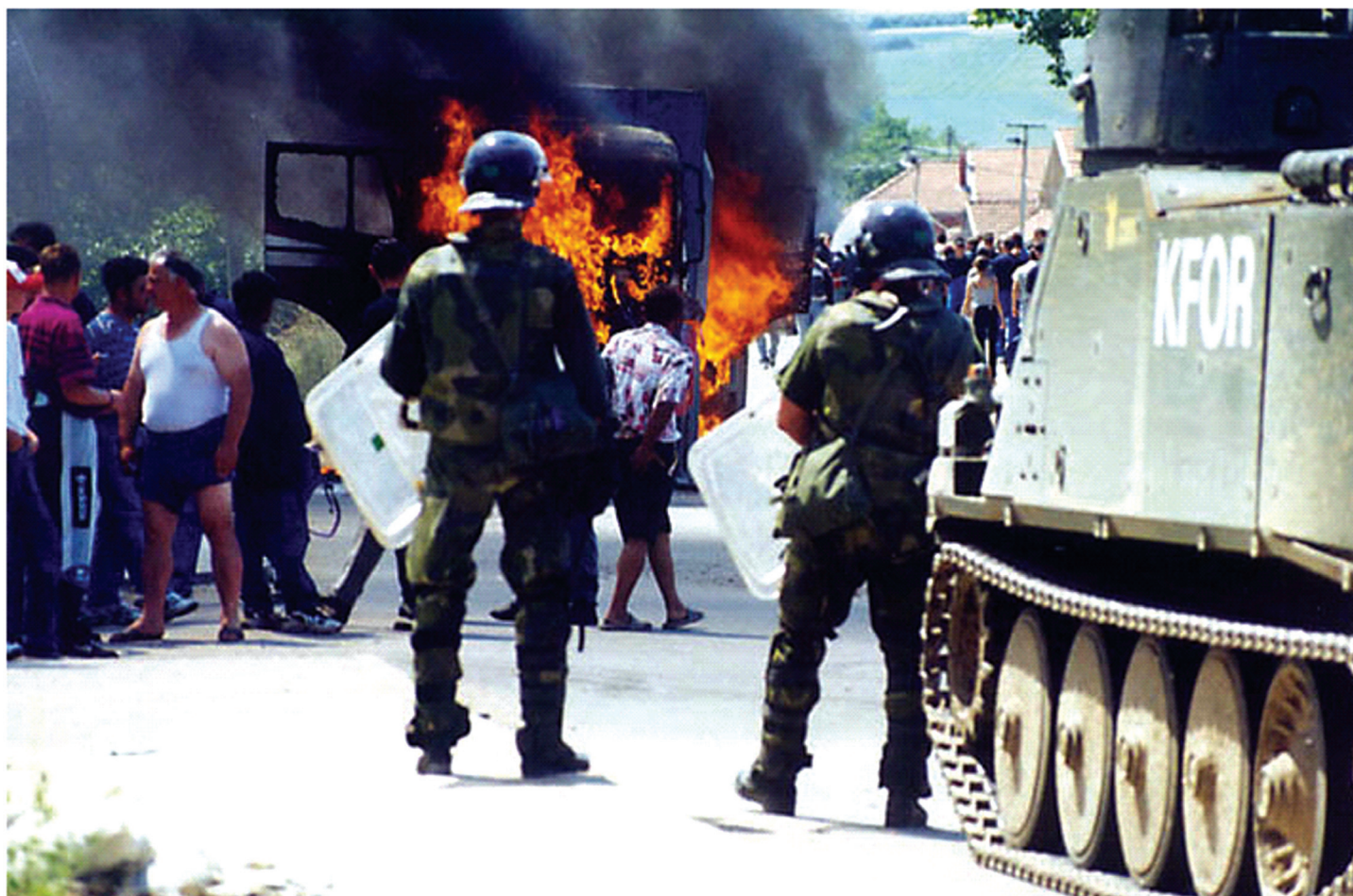
Upplopp, ett inslag i miljön Military Operations Other Than War