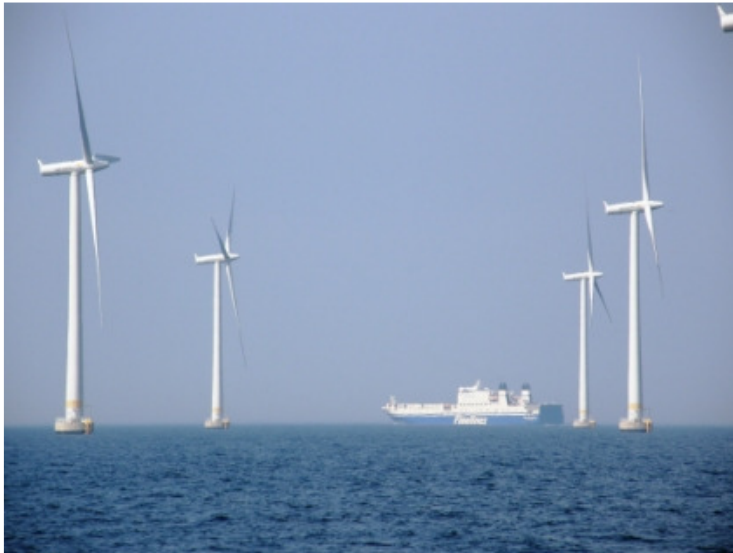
Fartyg passerar Lillgrundens vindkraftspark i Öregrund.