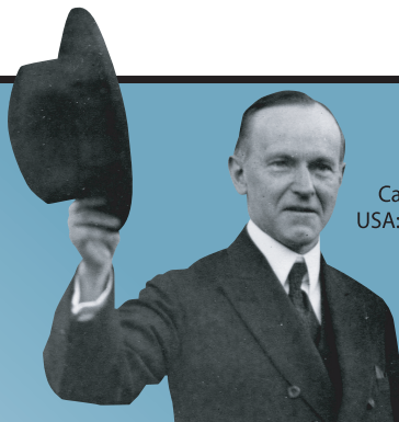
Calvin Coolidge USA:s 30:e president 1923–1929

Detta diagram kallas Calvin Coolidge's Revenge. Historien förtäljer att den amerikanske presidenten år 1928 uppvaktades av en delegation som ville köpa en division jaktplan för totalt tjugofem tusen dollar. Hans svar blev: "Varför kan vi inte bara köpa ett flygplan och låta flygarna turas om att flyga det?" Som framgår av diagrammet över prisutvecklingen på flygplan får Coolidge sin hämnd omkring 2050.