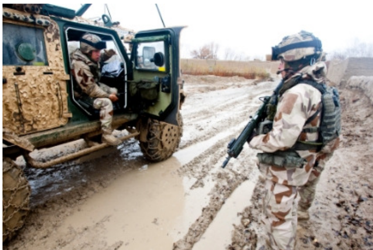
Bild: FS21 har tjänstgjort i Afgahnistan under 2011.