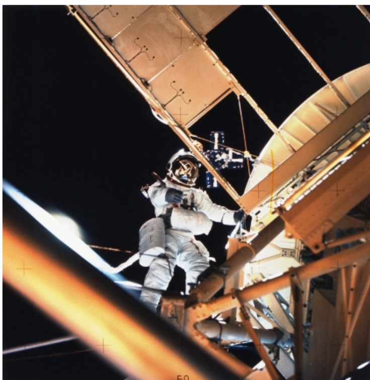
Den amerikanska NASA-astronauten Owen K. Garriott på rymdpromenad utanför rymdstationen Skylab 1973.

I rapporten "Rymden – arbetsplats eller slagfält?" diskuteras hur vi såväl militärt som civilt har blivit beroende av rymdtjänster. Läs mer »