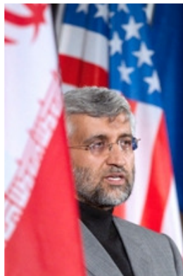
Samlingsrapporten från 2011