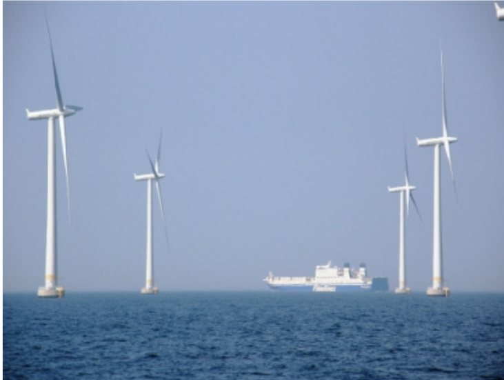
Fartyg passerar Lillgrundens vindkraftspark i Öregrund.