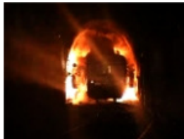
Bilden på explosionen i tunneln är tagen med höghastighetskamera.

Sprängningen övervakades av kameror och detektorer inne i vagnarna, och på tunnelns väggar och öppningar. Läs mer »