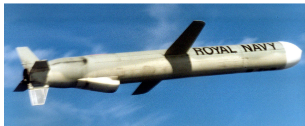
Gårdagens autonoma vapen – en Tomahawk-robot

Ordet ”beslut” återkommer ofta i debatten. Maskiner ska inte tillåtas att ”fatta beslut” om liv och död. Beslutet om liv och död handlar i militära operationer om beslut om vapeninsats, eller våldsverkan, och är ett beslut som fattas av en ansvarig befälhavare. Ansvaret för vapensystemets effekter ligger hos befälhavaren. Vilka effekter av en vapeninsats som är acceptabla med hänsyn till folkrätt och mänskliga rättigheter beror på fler saker än på vapnets funktion. Ansvaret för att en insats följer internationella (och nationella) lagar åligger de stridande parterna och ligger inte i tekniken. Oavsett vilka funktioner i ett system och moment i en vapeninsats som är automatiserade ligger ansvaret för beslut om användning av ett vapensystem och dess konsekvenser hos användarna. Med ökande komplexitet i systemen krävs mer av användarna för att kunna förstå och förutse konsekvenserna av användning. Det är ansvaret för användningen av tekniken som är borde ligga i fokus. En diskussion kring krav på förståelse för funktion, tillförlitlighet, effekt och konsekvenser av vapenanvändning kommer klargöra vilken teknik och vilken användning som är förenlig med internationell rätt.