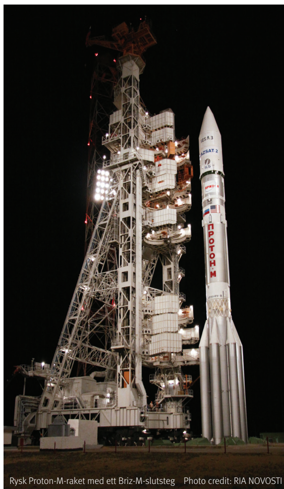
Rysk Proton-M-raket med ett Briz-M-slutsteg

NASA uttryckte tidigt sin oro 4 över att slutsteget med de två satelliterna skulle kunna explodera och skapa betydande mängder rymdskrot till fara för satelliter i närheten.