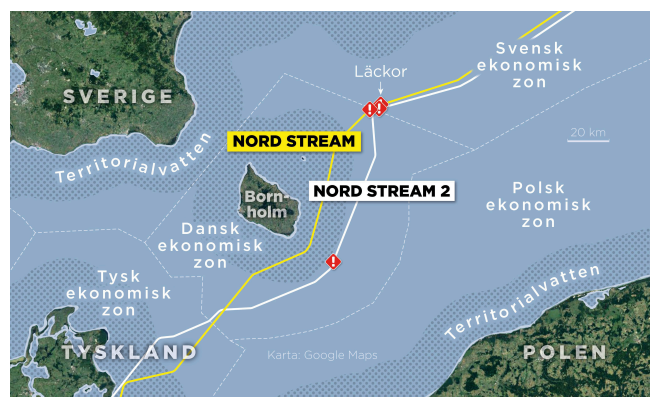
Figur 2: Karta över de fyra läckorna på gasledningarna samt ekonomiska zoner och territorialvatten.

Rörledningarnas rättsliga status har betydelse även för konkreta utredningsåtgärder. Enligt havsrättskonventionen har Sverige rätt att upprätta säkerhetszoner runt konstgjorda öar, anläggningar och andra konstruktioner i Sveriges ekonomiska zon. Det är dock oklart om, och i så fall på vilken grund, det finns en motsvarande rätt att upprätta säkerhetszoner runt rörledningar inom Sveriges ekonomiska zon.