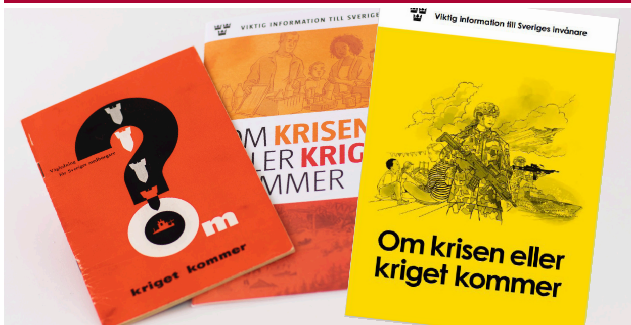
Figur 1. Broschyrer: Om kriget kommer, 1952. Om krisen eller kriget kommer, 2018. Om krisen eller kriget kommer, 2024. Bilden är ett montage.