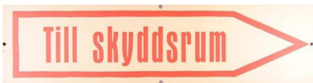
Figur 2. Skylt från Stockholms centralstation, Järnvägmuseum, CC-BY.

åtgärder. Särskilt problematiskt är det för kommuner och regioner där befolkningsskyddets personella och materiella resurser finns. En ytterligare komplicerande faktor är att idag konkurrerar befolkningsskydd också med nya begrepp såsom skydd av civilbefolkningen och har vidare ett ambivalent förhållande till sin föregångare civilförsvar som fortfarande används i internationella sammanhang, och det snarlika men konceptuellt väsensskilda Civilt försvar .