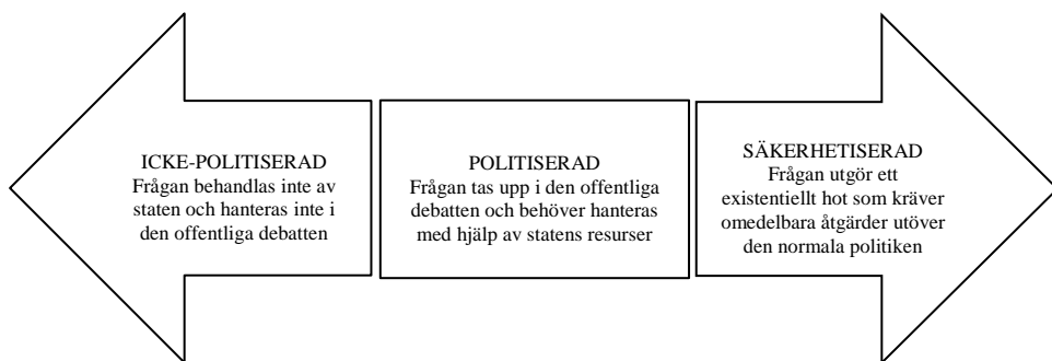
Figur 1. Ett spektrum från icke-politiserad till säkerhetiserad 97

Översatt till det akademiska fältet om internationella relationer kan man förstå denna form av säkerhetisering som den mest extrema formen av politik (se figur 1 nedan) vars frågor sträcker sig allt ifrån icke-politiserade (med betydelsen att staten överhuvudtaget inte bryr sig om frågan och att den inte diskuteras i offentlig debatt) till att vara politiserade (med betydelsen att frågan till stor del behandlas i offentlig debatt och kräver allokering av statliga resurser) för att slutligen bli säkerhetiserad (med betydelsen att frågan presenteras som ett existentiellt hot vilket kräver omedelbara och kraftiga åtgärder även utanför normalt förfarande). 96