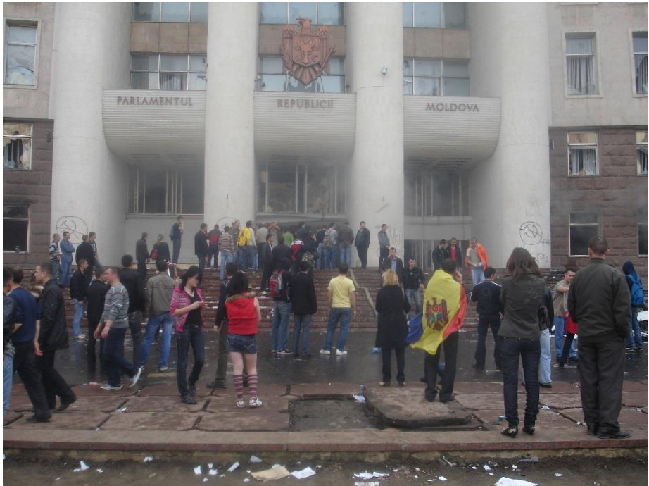
Parlamentsbyggnaden i Chisinau stormades under de våldsamma demonstrationerna i samband parlamentsvalet i april 2009