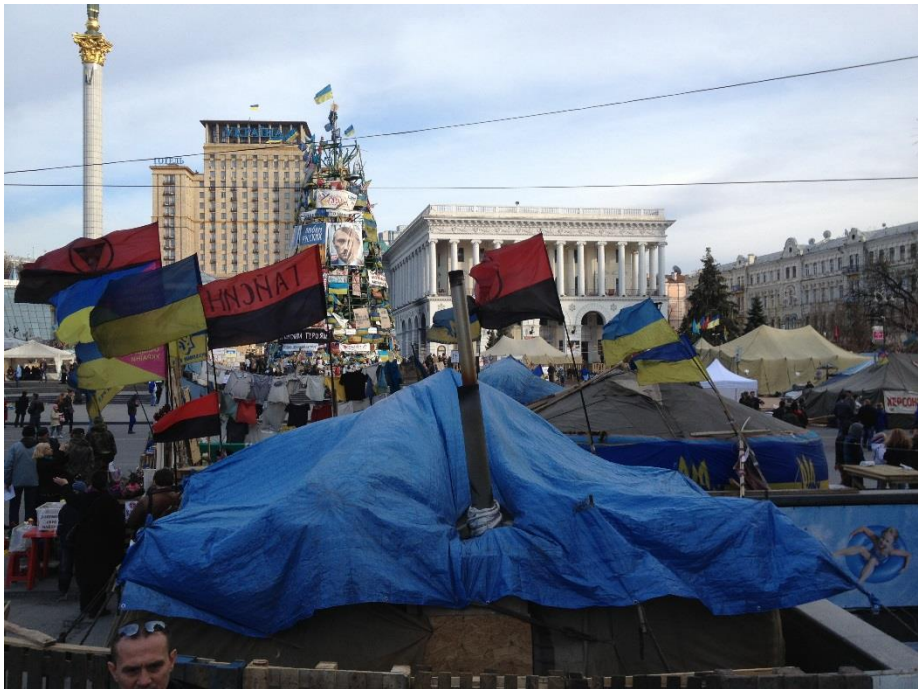
Majdan Nezalezjnosti (Självständighetstorget) i Kiev i april 2014

satt stopp för "den ökända multivektororienteringen" inom landets utrikespolitik. 163 Enligt presidenten innebar Ukrainas politiska orientering idag "en otvetydig och irreversibel kurs mot EU-medlemskap och en djupgående europeisering av Ukraina". 164