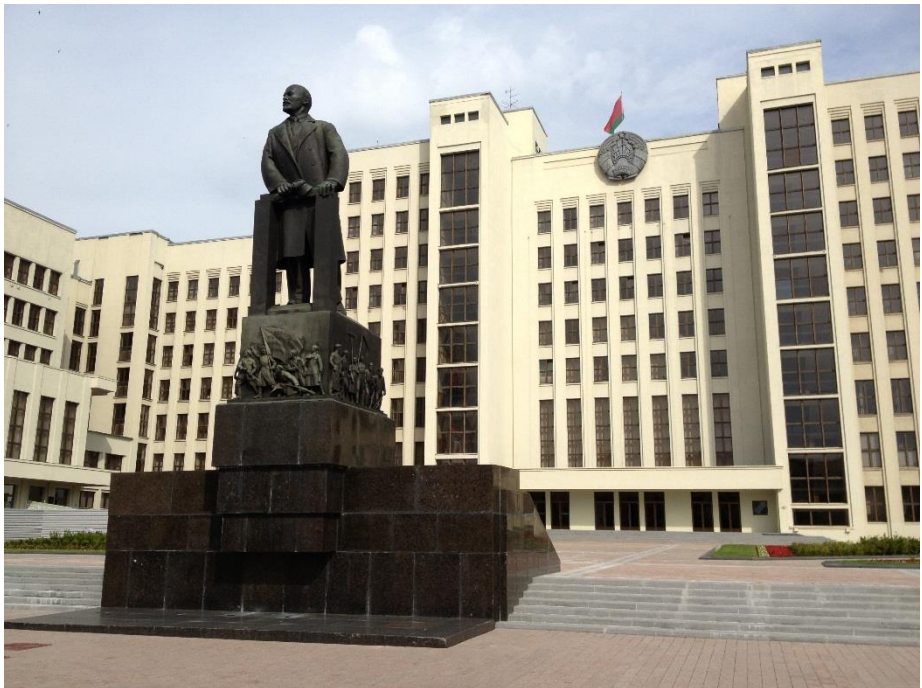
Lenin står kvar utanför regeringsbyggnaden på Självständighetstorget (f.d. Lenintorget) i Minsk

till Belarus förutsatt att de kommande valen hölls i enlighet med internationell standard och att landets ledning slog in på en mer demokratisk bana. 146