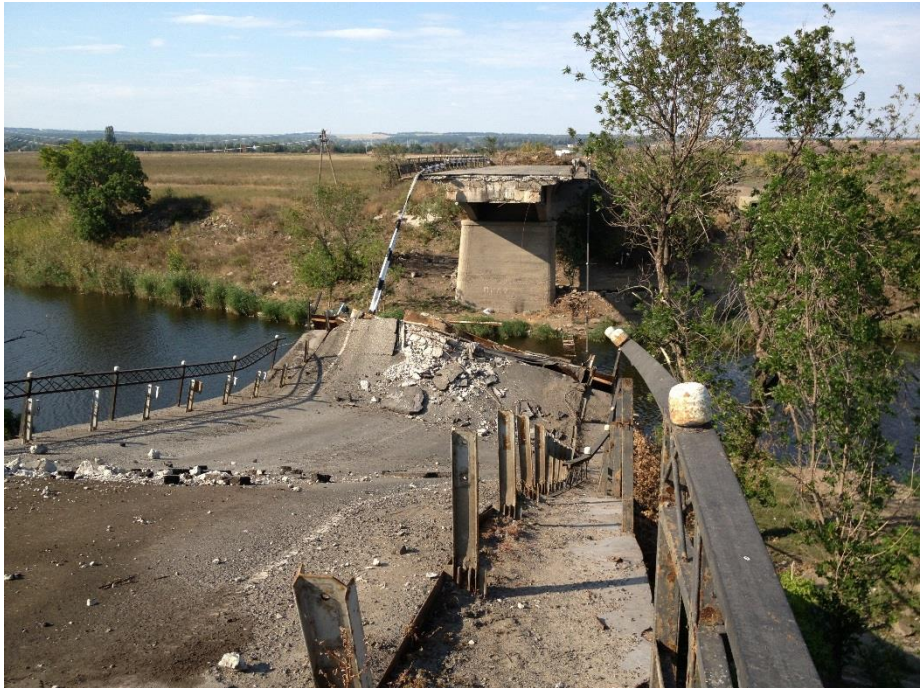
Krigsraserad bro i utkanten av Slovjansk, Donetsk oblast, september 2014

vacuum och dess framgångar har kommit att bero i hög utsträckning på hotet om användande av militära medel. 123