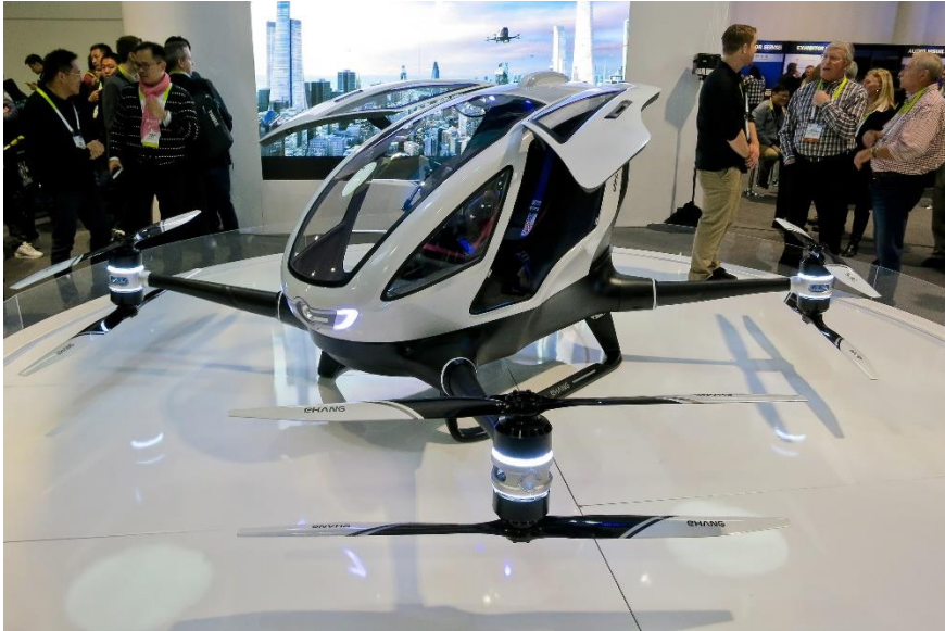
Figur 2: Första elektriska passagerardrönaren EHang 184, CES 2016 (Flickr / Alex Butterfield, CC BY 2.0).

För att luftrummet ska kunna användas effektivt av räddningstjänsten i en miljö med reguljär kommersiell luftfartygstrafik krävs andra förhållningssätt till luft- rumssamordning. Sådana lösningar som innefattar komplexa tjänster med en hög grad av automatisering, tillåter avancerade operationer i tätort och erbjuder integrerade gränssnitt med bemannade luftfart, lämpar sig bäst att hanteras av AI-algoritmer. Se till exempel (Stroup & Niewoehner, 2019; Stroup, Niewoehner, Apaza, Mielke, & Mäurer, 2019; Athavale, Baldovin, Mo, & Paulitsch, 2020).