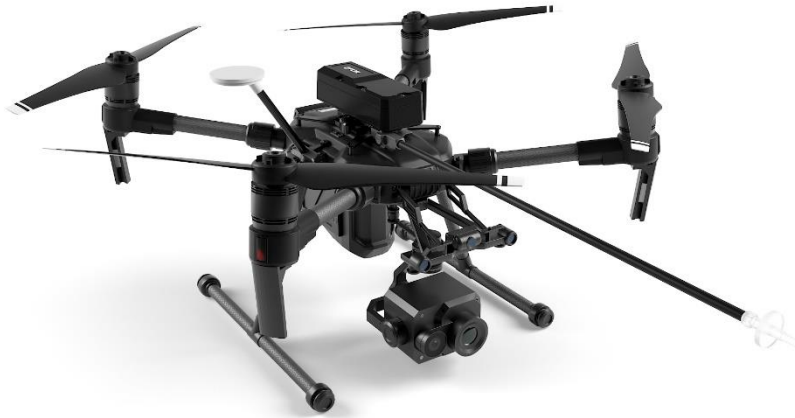
Figur 3: Matrice 200 serien med FLIR Muve C360 flergasdetektor.

Trots framgångar finns det förstås möjligheter för flera förbättringar i sådana system då tekniken blir allt mognare. AI-algoritmer kan användas så att systemen integrerar all tillgänglig information och automatiskt finjusterar inställningarna så att de blir mer användarvänliga och tillgängliga för räddningstjänsten.