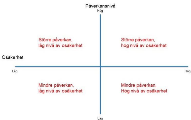
Figur 1. En fyrfältsfigur där den ena axeln visar påverkansnivå och den andra axeln visar nivån av osäkerhet. Drivkrafterna placeras in i fyrfältet efter den bedömda nivån av påverkan och osäkerhet.

För att underlätta diskussion om drivkrafterna i relation till varandra har metoden Driver mapping använts. Metoden går ut på att de identifierade drivkrafterna placeras inom ett fyrfält (se figur 1). Oftast används metoden i workshop-format. 7 Under intervjuerna reflekterade forskarna och experterna över drivkrafternas påverkan och osäkerheter. Utifrån en analys av intervjuerna samt relevant litteratur har drivkrafterna sedan placerats inom fyrfältet efter påverkansnivå på säkerhets- och försvarspolitiskt samarbete inom EU och nivåer av osäkerheter som omger drivkrafterna. De drivkrafter som bedömts ha hög påverkan placerades i de övre delarna, och dessa drivkrafter är de som tas upp närmare i studien. Denna figur används i kapitel 8 om drivkrafter av relevans mot 2050.