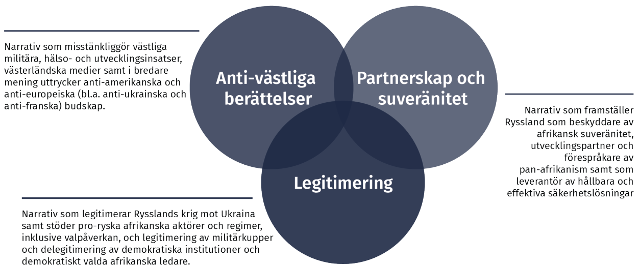
Figur 1 Centrala teman i rysk informationspåverkan i Afrika.

Även om informationsinsatserna återigen har intensifierats de senaste åren har Ryssland lång erfarenhet av att använda desinformationskampanjer för att försvaga väst och främja sina egna intressen. Under kalla kriget utgjorde sådana kampanjer en central del av Sovjets psykologiska krigföring, även i Afrika. Ett framstående exempel är KGB:s/Stasis "Operation Denver" som under 1980-talet spred tesen att HIV skapades av Pentagon inom ramen för biovapenforskning. Kampanjen var global, men dess huvudsakliga fokus och största genomslag var i Afrika. Grogrunden för denna typ av desinformation är särskilt stark i regionen på grund av det generellt låga förtroendet för hälsomyndigheter, ett arv från kolonialtidens medicinska övergrepp som lämnat djup och varaktig misstro. 27 Denna misstro förstärks dessutom av en stor mängd lokalt producerad medicinsk desinformation och konspirationsteorier.